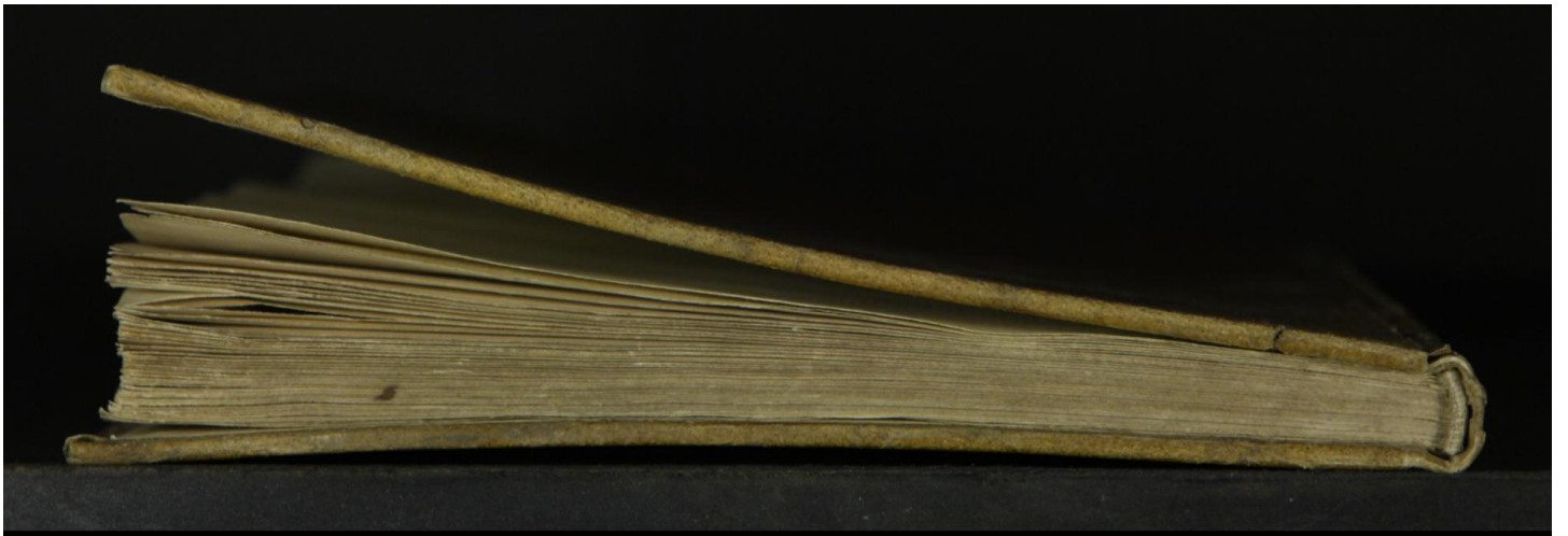
CFMAGL_03.01.041/a